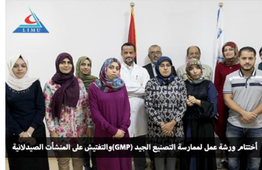
اختتام ورشة عمل لممارسة التصنيع الجيد (GMP) والتفتيش على المنشآت الصيدلانية