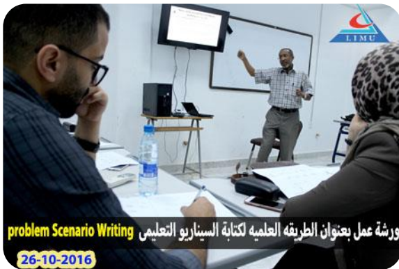
ورشة عمل بعنوان الطريقة العلمية لكتابة السيناريو التعليمي Problem Scenario Writing

في إطار الإرتقاء بمستوى الاداء لأعضاء هيئة التدريس بكلية العلوم الطبية الاساسيه بالجامعة عُقدت اليوم الاربعاء 2016-10-26 بمقر الكليه المؤقت الجلسة الثانيه من ورشة العمل التي يشرف عليها وكيل الجامعة لشؤون التعلم أ.د. عادل التواتي وبحضور السيد عميد الكليه د. عبدالله المنصوري واعضاء هيئة التدريس بالكلية .