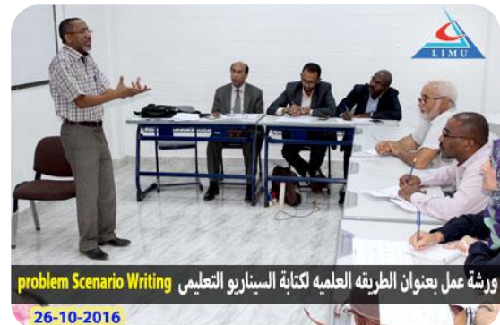
ورشة عمل بعنوان الطريقة العلمية لكتابة السيناريو التعليمي Problem Scenario Writing