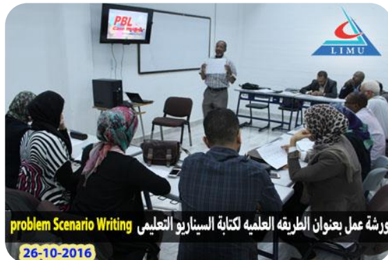
ورشة عمل بعنوان الطريقة العلمية لكتابة السيناريو التعليمي Problem Scenario Writing